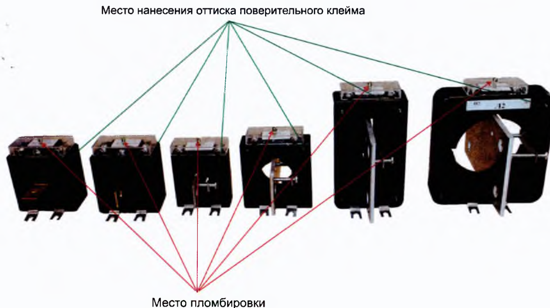
Рисунок 1 - Трансформаторы тока Т-0,66 УЗ

Для предотвращения доступа к вторичной обмотке и сердечнику трансформатора на корпусе в месте установки соединительных винтов корпуса предусмотрено место для нанесения оттиска поверительного клейма. Выводы вторичной обмотки трансформатора закрываются прозрачной пластиковой крышкой и пломбируются после установки трансформатора. Общий вид трансформаторов тока, места пломбировки и нанесения оттиска поверительного клейма изображены на рисунках 1 и 2.